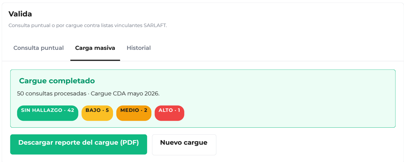
Figura 6. Resumen del cargue completado. El boton verde descarga el reporte PDF agregado.